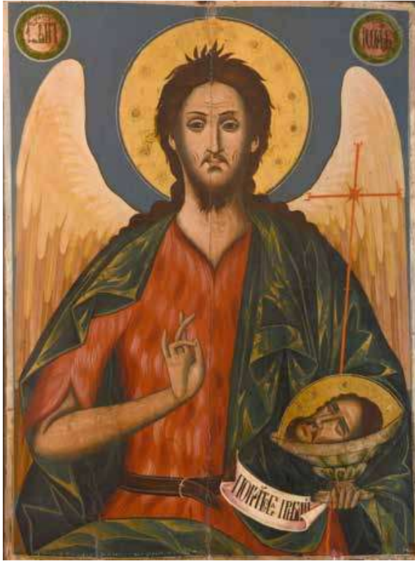
16. Св. Йоан Кръстител, 1832 г.