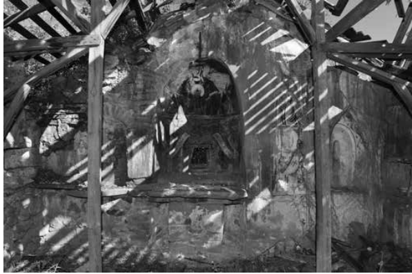
2. Източна стена, олтар

Към 1896 г. вторият притвор е преграден на две – помещение за трапеза и малък външен притвор 3 . Строителите на църквата не са известни 4 . Днес църквата е напълно запустяла и полуразрушена. РЕСТАВРАЦИЯ – Липсват данни за извършени реставрационни намеси. След падането на покрива е изградено временно покритие, което вече е разрушено.