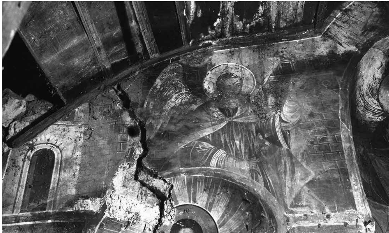
11. Арх. Гавриил от Благовещение, арх. снимка от 1976 г.