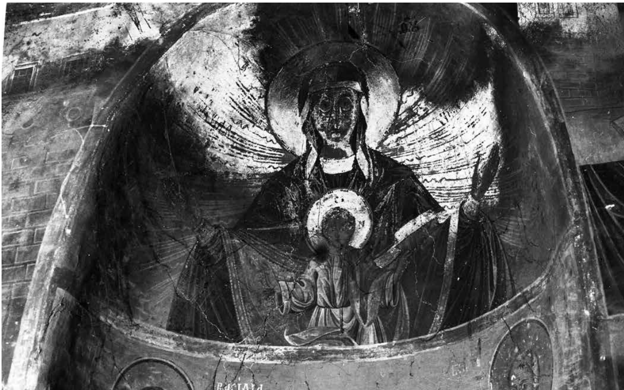
9. Богородица Широкая небес, арх. снимка от 1976 г.