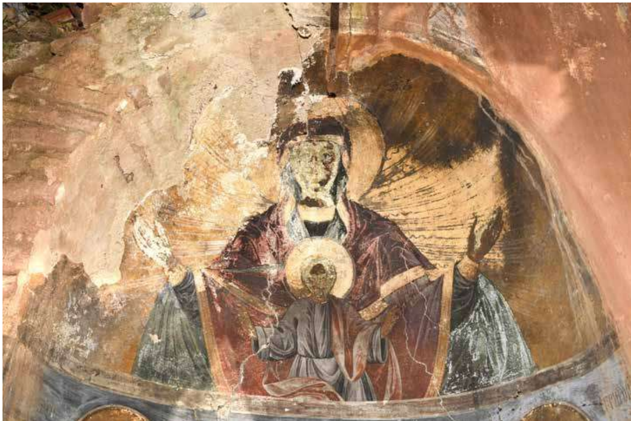
6. Богородица Ширишая небес, олтарна апсида