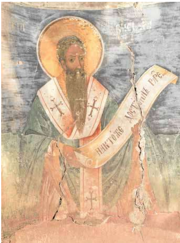
7. Св. Василий Велики