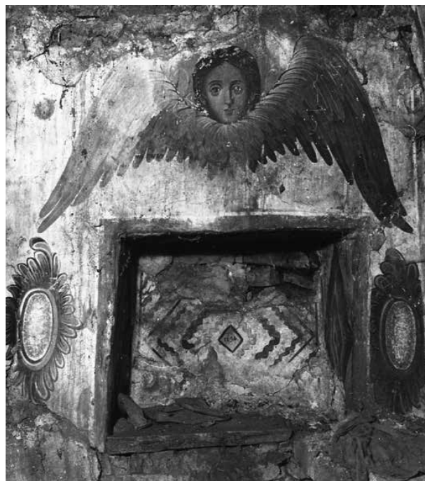
13. Надпис с годината на изписване, арх. снимка от 1976 г.