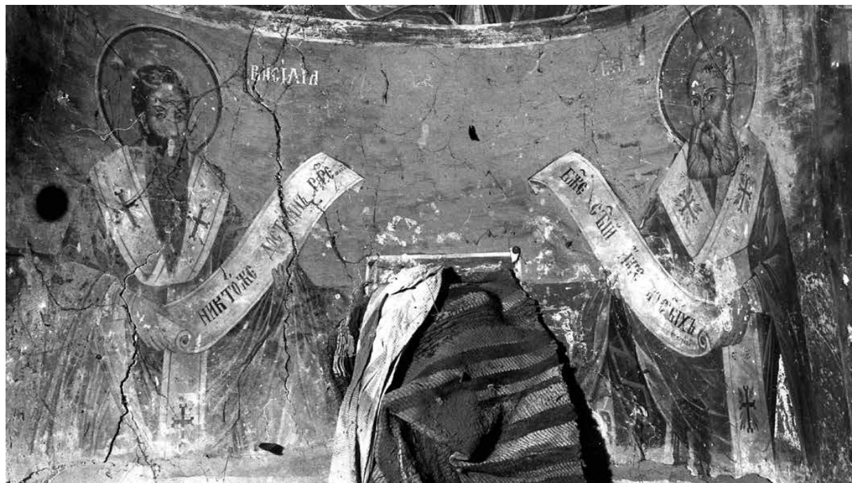
10. Св. Василий Великий и св. Григорий Богослов, арх. снимка от 1976 г.