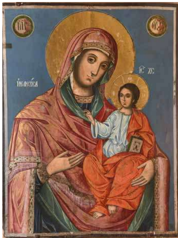
14. Богородица Одигитрия, 1831 г.