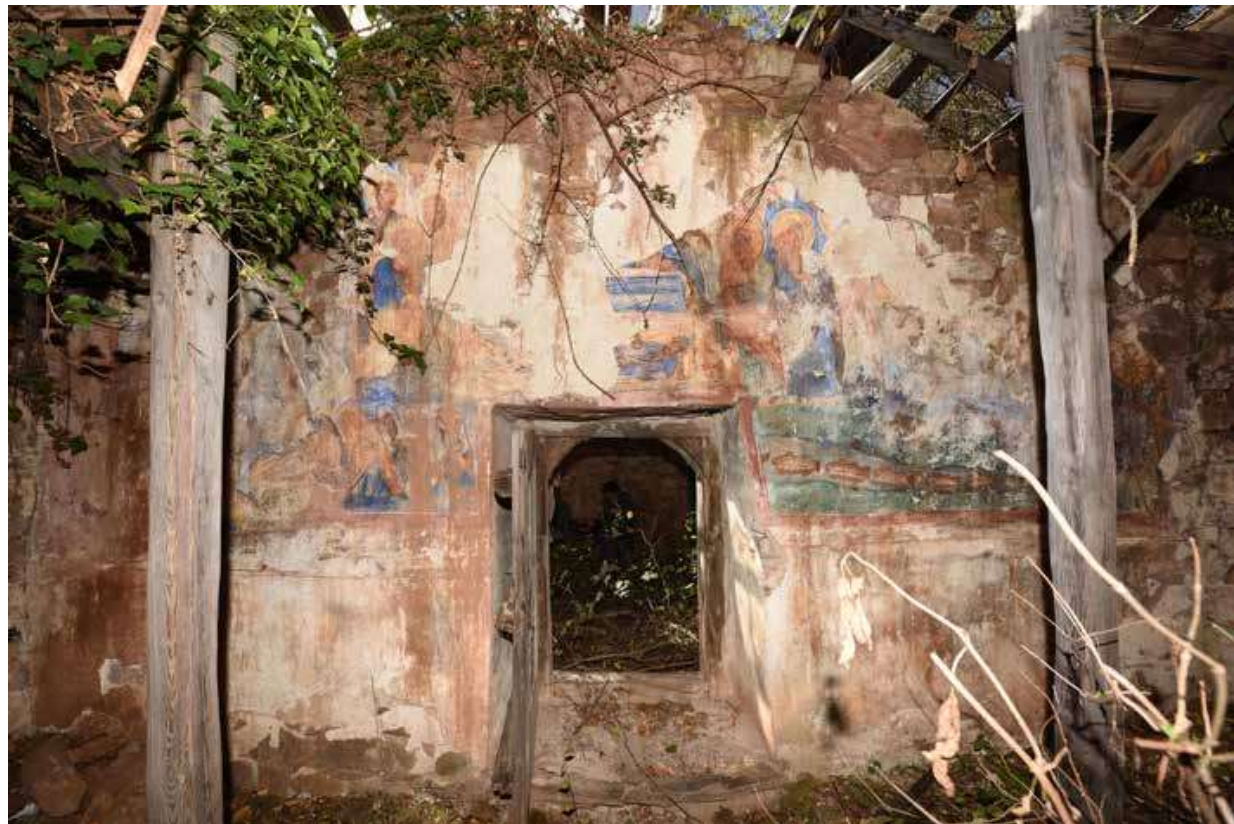
4. Западна стена на наоса