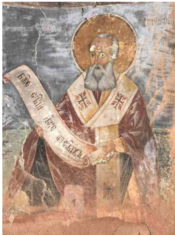
8. Св. Григорий Богослов