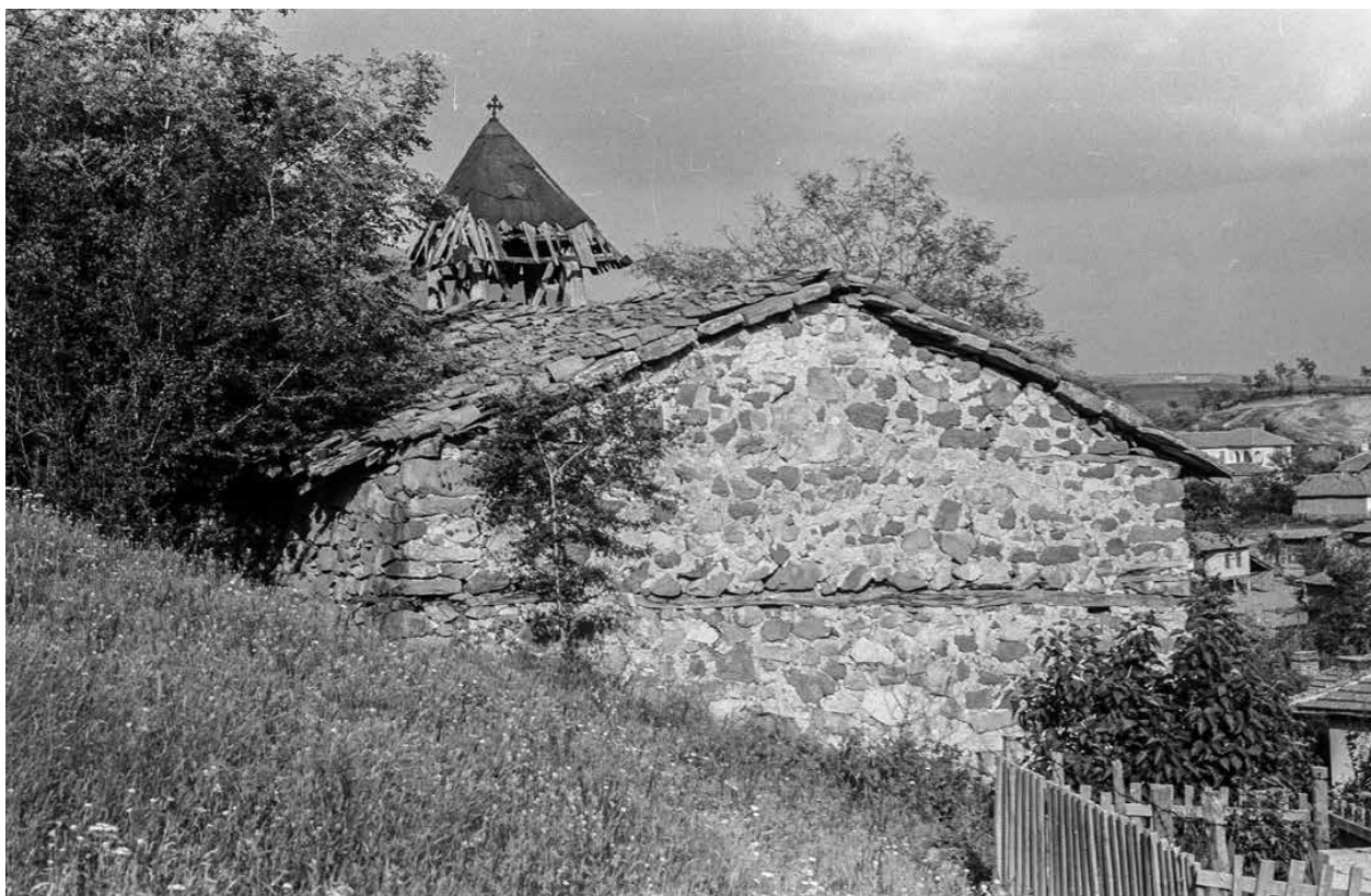
1. Общ изглед на църквата, архивна снимка от 1960 г.