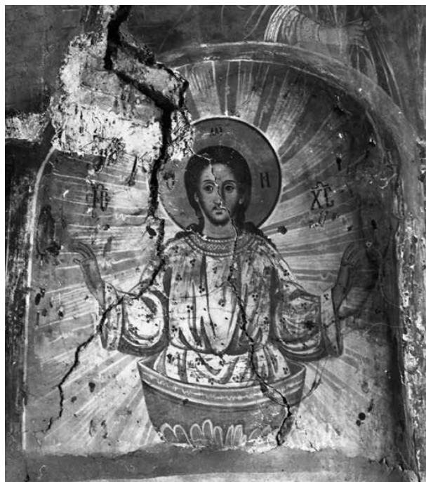
12. Христос в гроба, арх. снимка от 1976 г.