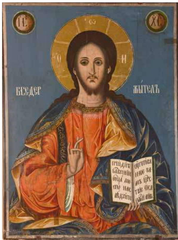
15. Христос Вседържител, 1834 г.