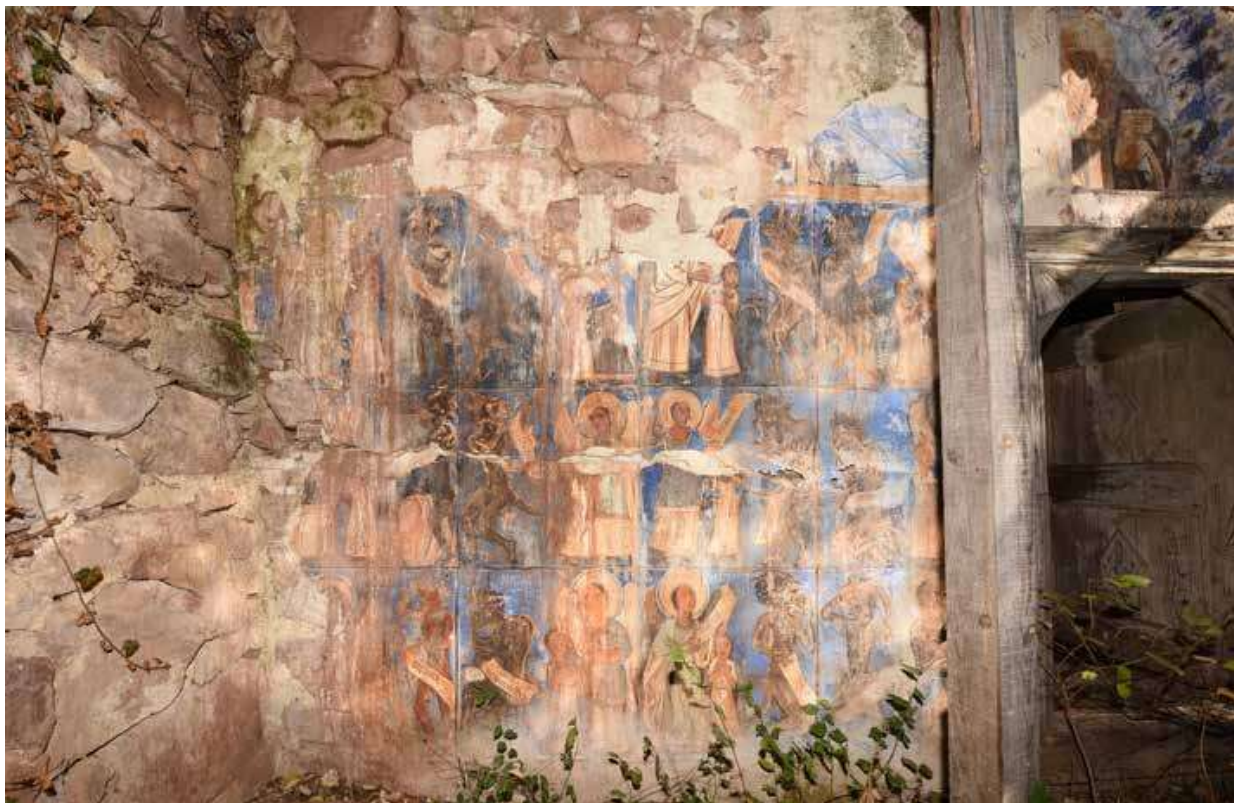
5. Митарствата на душата, източна стена на притвора