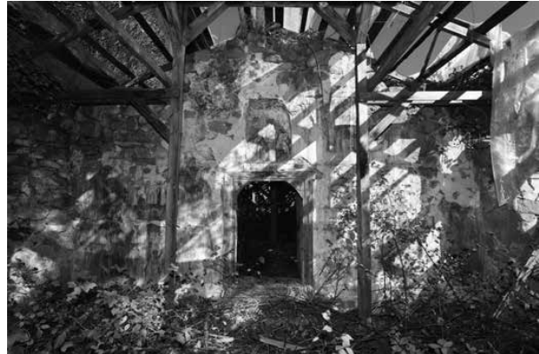
3. Източна стена на притвора

СОПК на 13.11.1968 г. Поради наличието на добре запазени стенописи от Коста Вальов и по настояване на В. Пандурски е взето решение църквата да бъде обявена за паметник на изобразителното изкуство с категория „национално значение“.